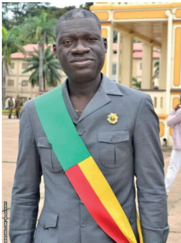
Honorable Jean Mejor ZANNOU député UP le Renouveau de la 6ème circonscription électorale